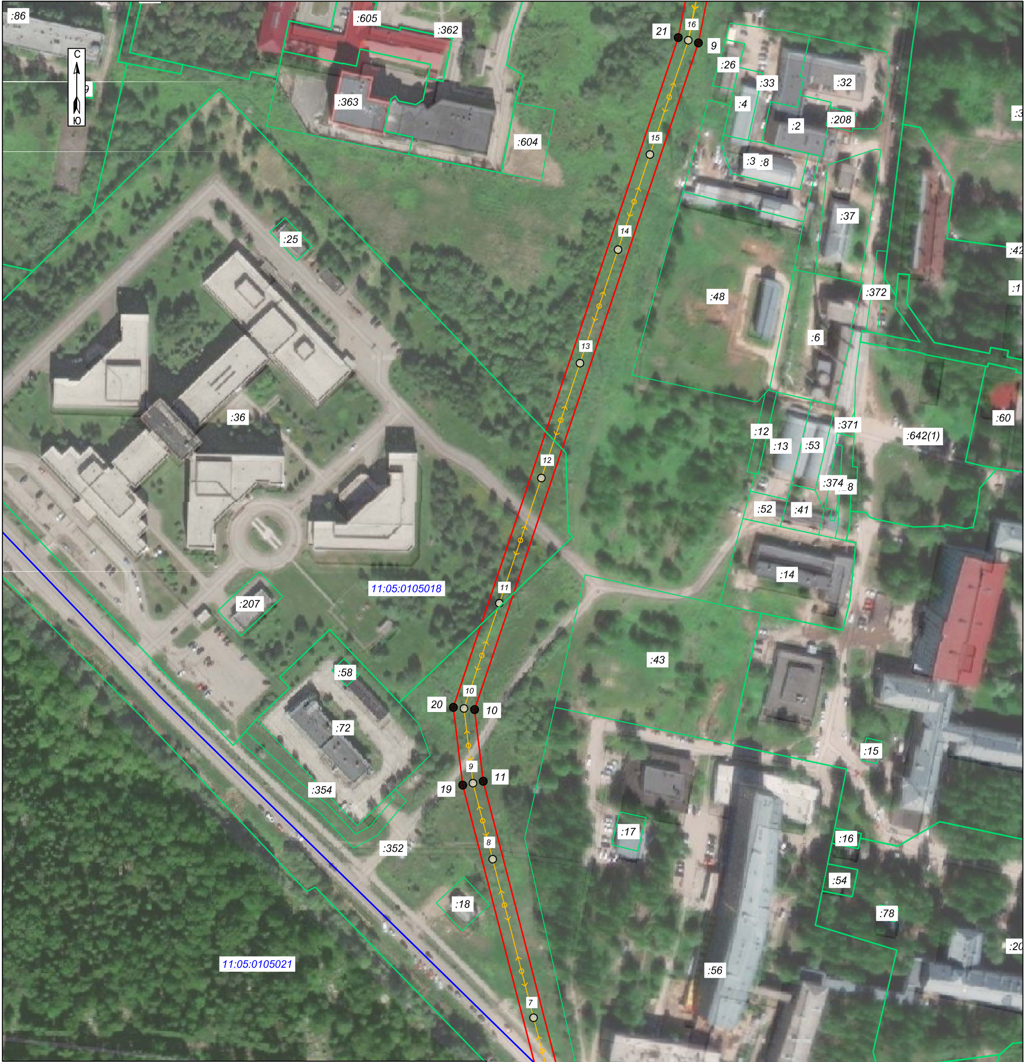
Схема расположения границ публичного сервитута: ВЛ-10КВ ПС"ЮЖНАЯ" ф.314,ф.363-РП-4 2-ХЦЕПНАЯ